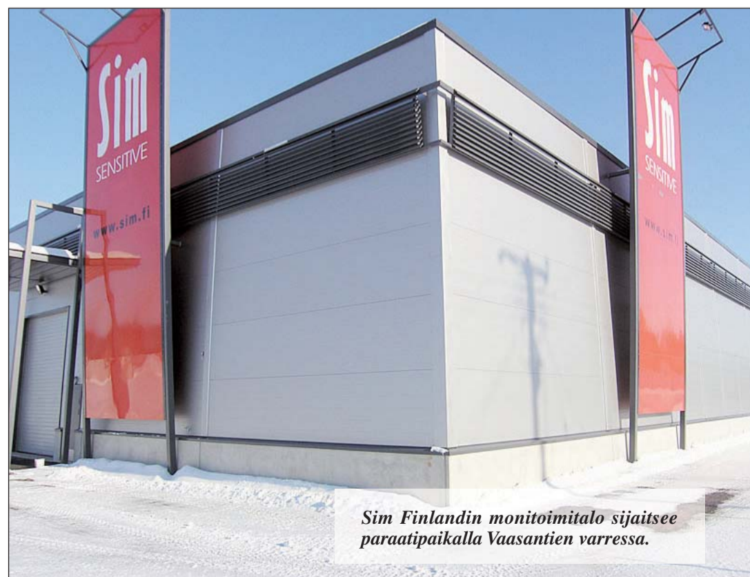
Sim Finlandin monitoimitalo sijaitsee paraatipaikalla Vaasantien varressa.