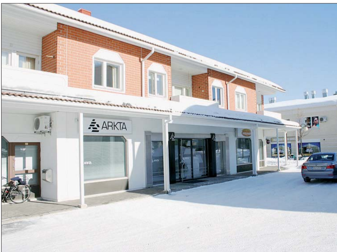
Arktan oma toimitalo kätkee sisäänsä monta yritystä: emoyhtiö Arkta Oy:n, Arkta Rakennuttajat Oy:n ja Rakennustoimisto Arkta Oy:n.