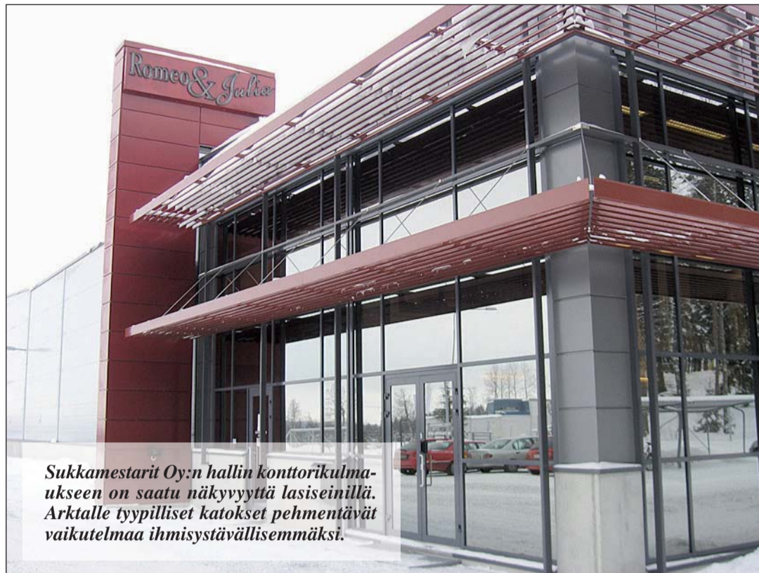
Sukkamestarit Oy:n hallin konttorikulmukseen on saatu näkyvyyttä lasiseinillä. Arktalle tyypilliset katokset pehmentävät vaikutelmaa ihmisystävällisemmäksi.

Hallin pääurakoitsijaa ei kilpailutettu. Arktan toimintatavat ja työn jälki olivat tiedossa, joten valinta