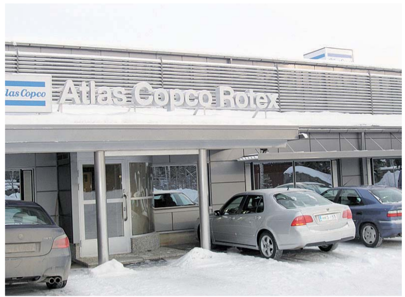
Terästä ja lasia yhdistävä moderni sisäänkäynti sopii hyvin metallialan yritykselle.